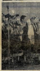
На адмыках: (алева ўверсе) іраўніў ансамбля Канстанціна ДАМАТАЛА, на астатніх адмыках — сцэны з канцэрта.